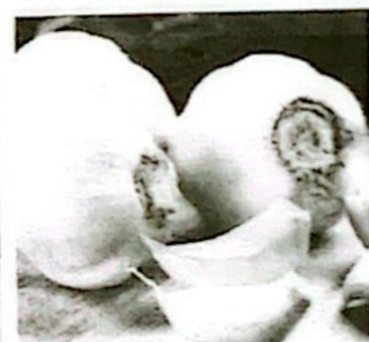
BAWANG PUTIH KETERSEDIAAN: 22 TON KEBUTUHAN: 17,29 TON