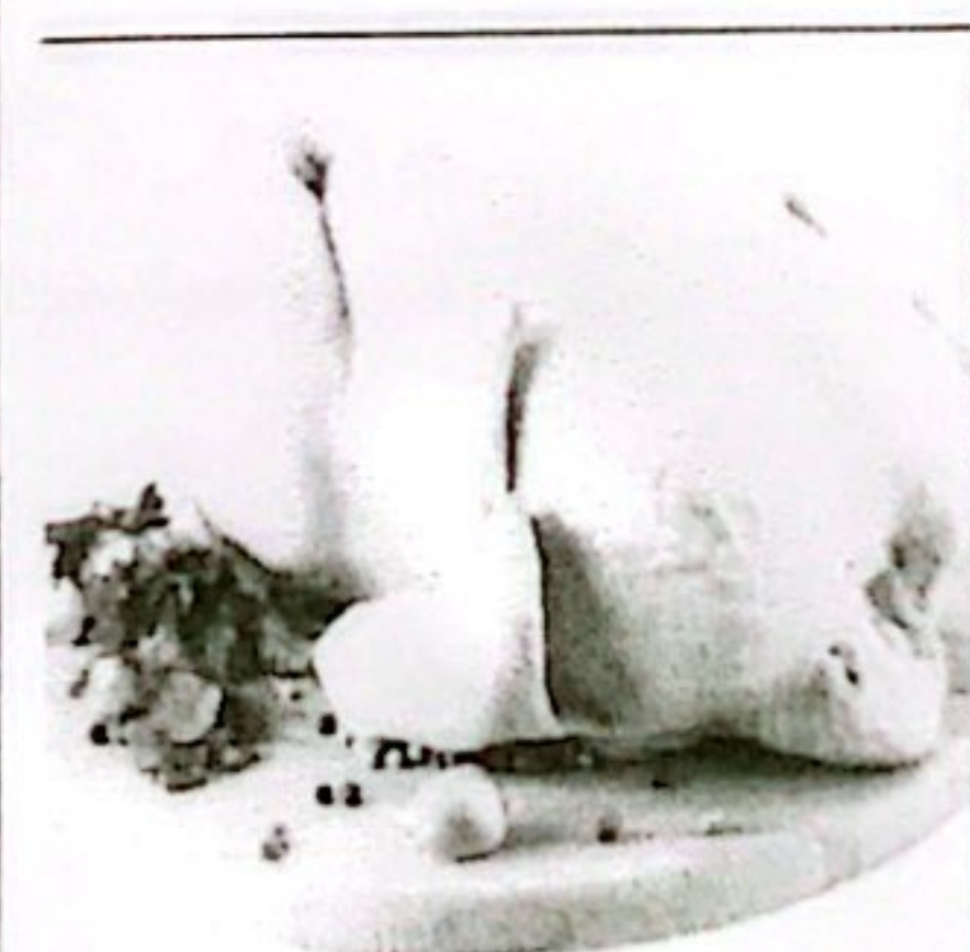
DAGING AYAH KETERSEDIAAN: 137,05 TON KEBUTUHAN: 112,32 TON