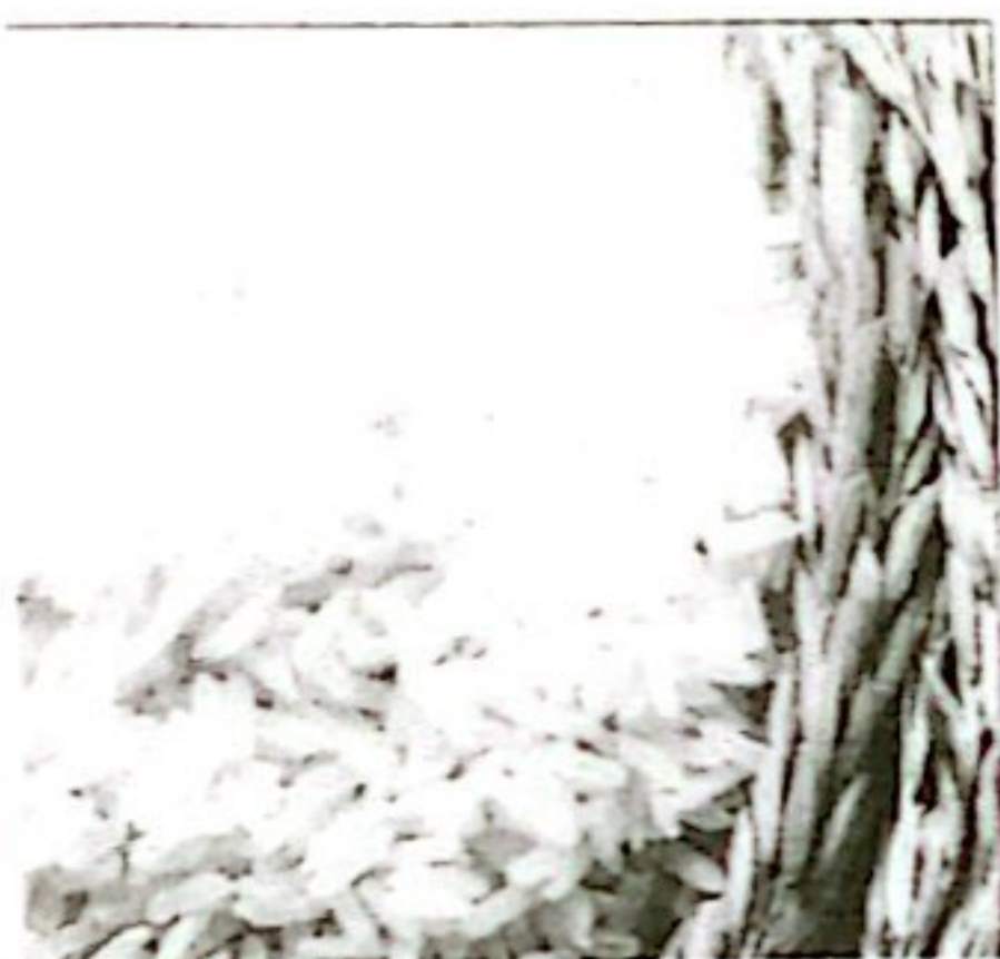
BERAS KETERSEDIAAN: 1.500,55 TON KEBUTUHAN: 1.354,85 TON

Sistem Monitoring Stok Pangan Pokok Strategis Mencakup Data dan Informasi Ketersediaan dan Kebutuhan Stok Kabupaten Rokan Hulu Yang Dilakukan Setiap Minggu