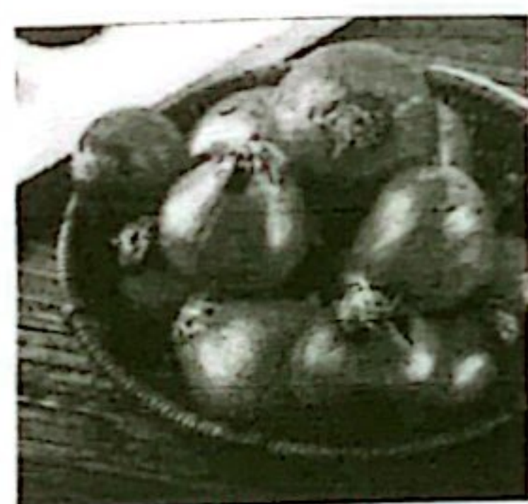
BAWANG MERAH KETERSEDIAAN: 58,55 TON KEBUTUHAN: 43,7 TON