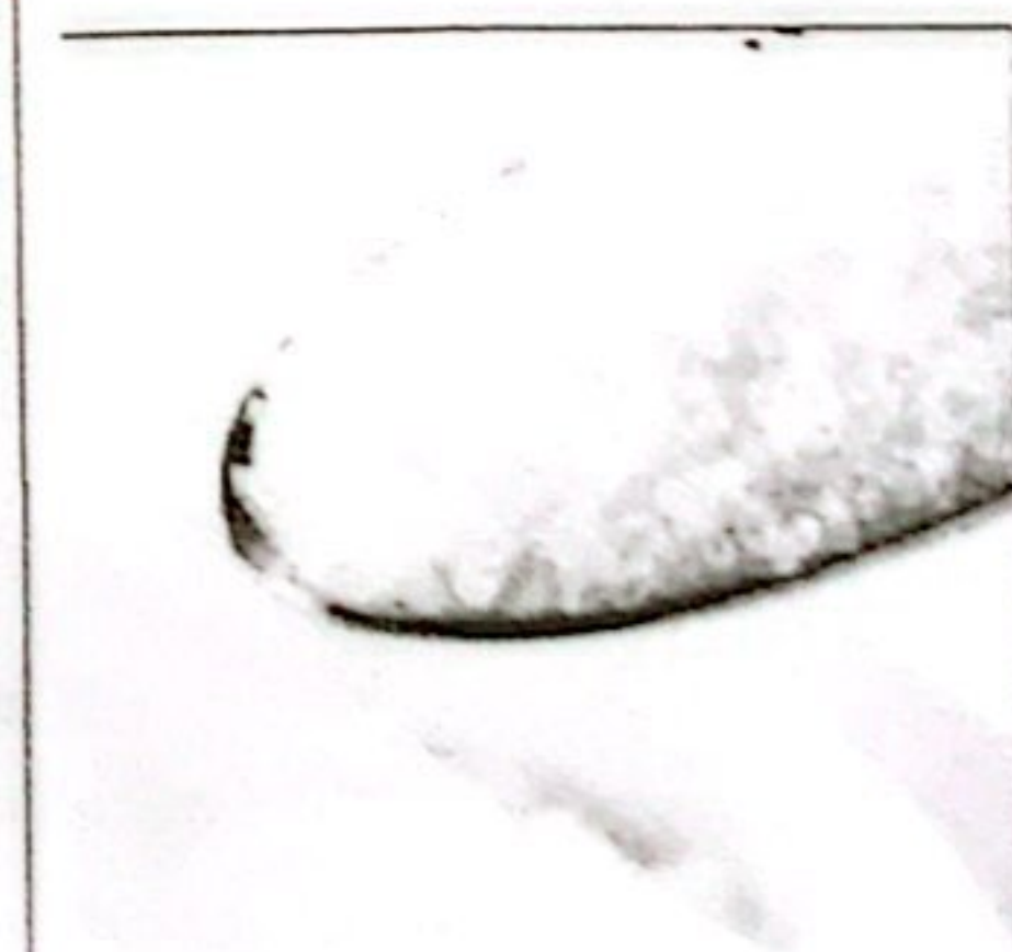
GULA PASIR KETERSEDIAAN: 94,65 TON KEBUTUHAN: 63,95 TON