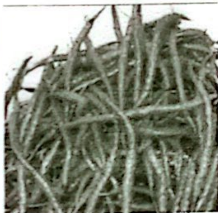
CABE MERAH KETERSEDIAAN: 74 TON KEBUTUHAN: 63,12 TON