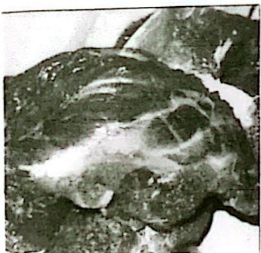
DAGING SAPI KETERSEDIAAN: 43,33 TON KEBUTUHAN: 40,99 TON