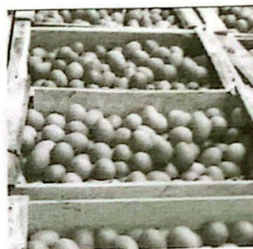
TELUR KETERSEDIAAN: 133 TON KEBUTUHAN: 81,04 TON