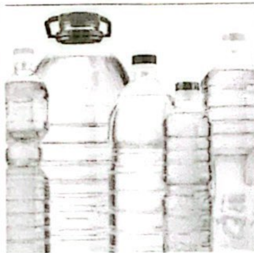
MINYAK GORENG KETERSEDIAAN: 190,35 TON KEBUTUHAN: 150,41 TON