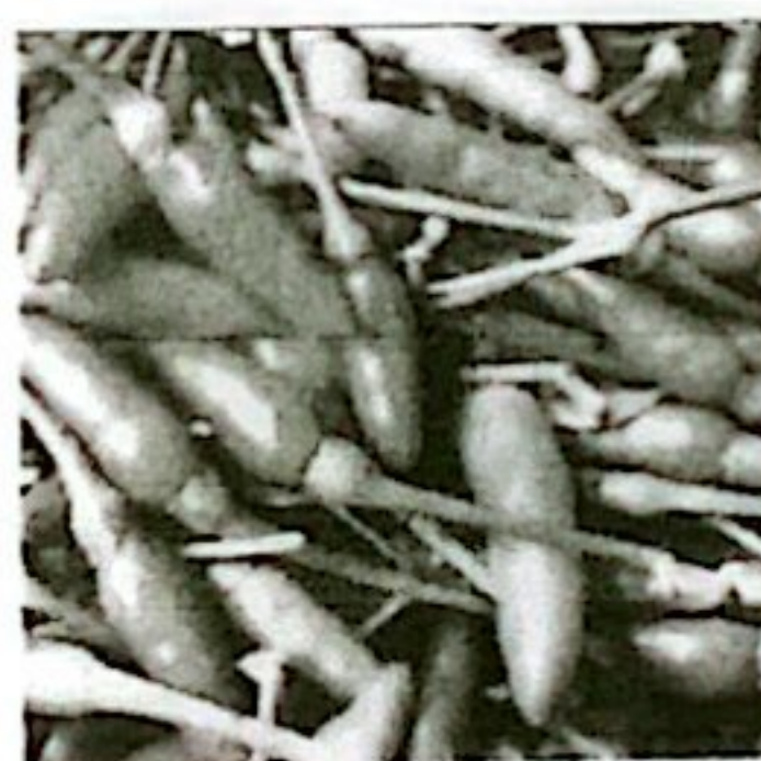
CABE RAMIT KETERSEDIAAN: 20,23 TON KEBUTUHAN: 13,03 TON