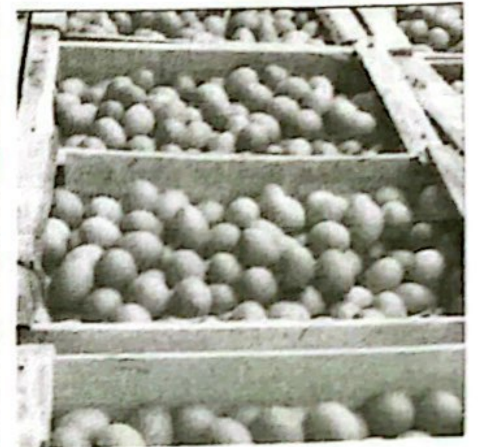
TELUR KETERSEDIAAN: 84,83 TON KEBUTUHAN: 64,83 TON