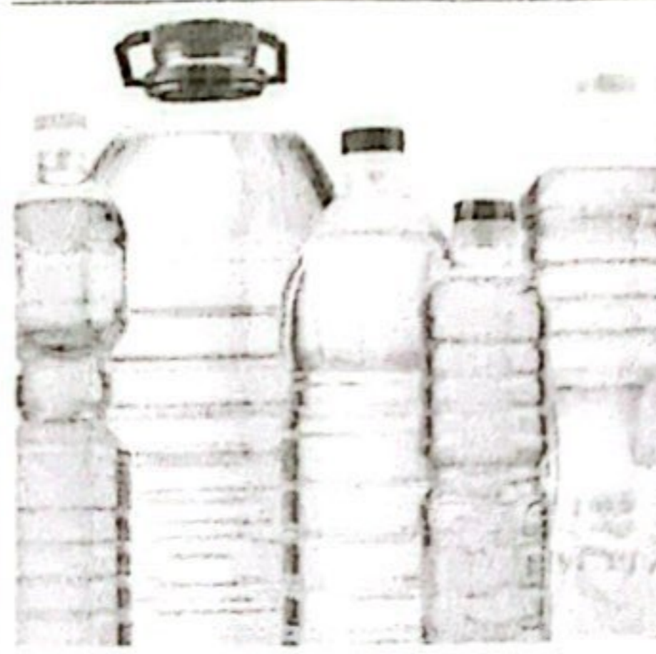
MINYAK GORENG KETERSEDIAAN: 150,31 TON KEBUTUHAN: 120,33 TON