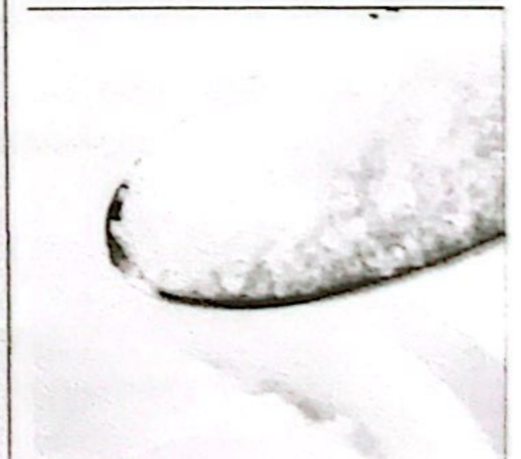
GULA PASIR KETERSEDIAAN: 77,16 TON KEBUTUHAN: 51,16 TON

*Sumber: Bidang Ketersediaan dan Distribusi Pangan Dinas Ketahanan Pangan dan Perikanan Kab. Rokan Hulu