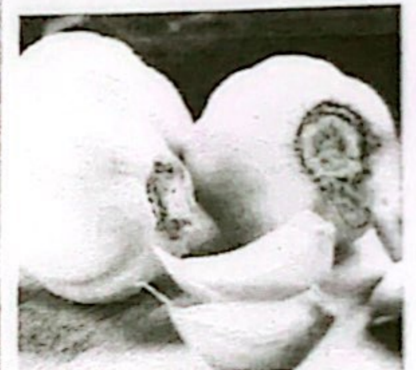
BAWANG PUTIH KETERSEDIAAN: 25,26 TON KEBUTUHAN: 13,83 TON