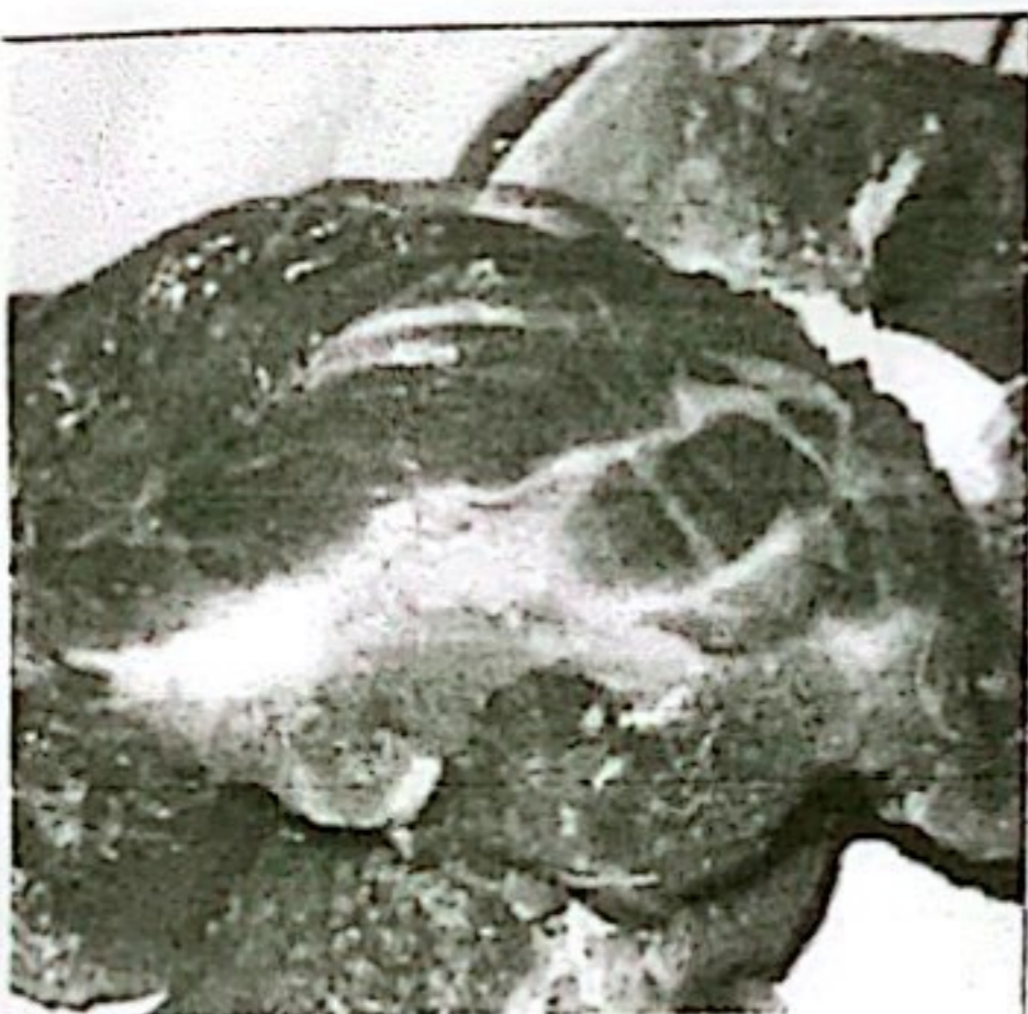
DAGING SAPI KETERSEDIAAN: 49,99 TON KEBUTUHAN: 32,79 TON