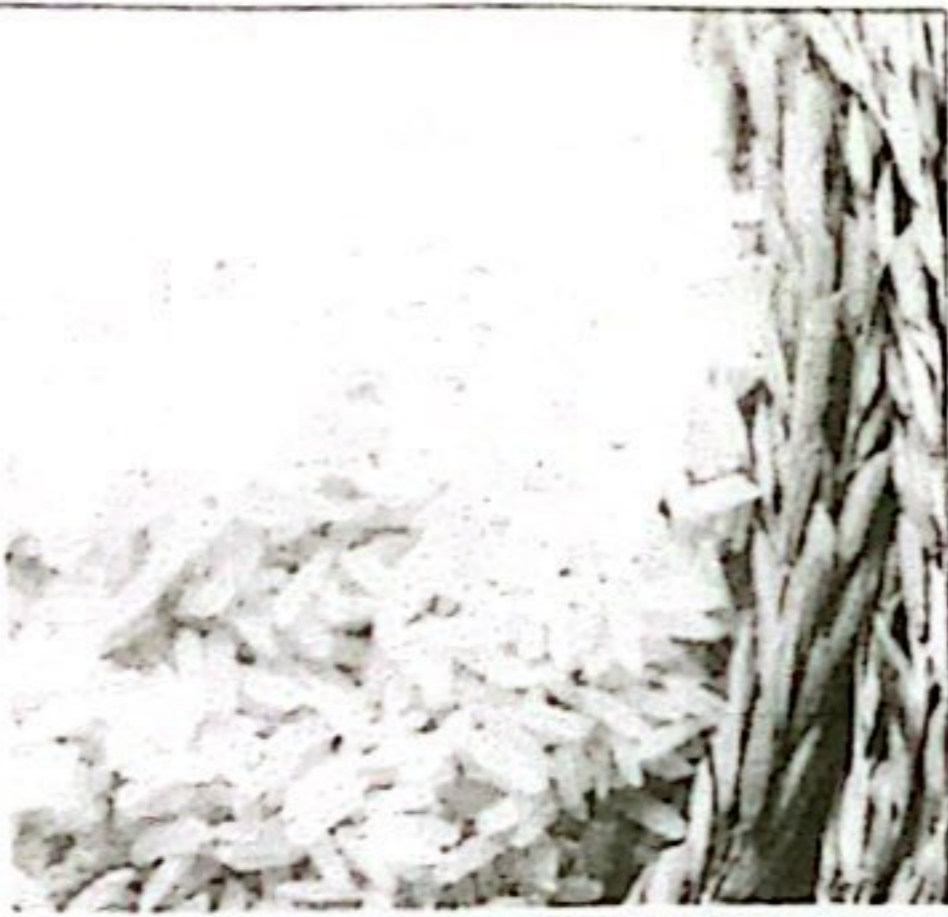
BERAS KETERSEDIAAN: 1.138 TON KEBUTUHAN: 1.083,88 TON

Sistem Monitoring Stok Pangan Pokok Strategis Mencakup Data dan Informasi Ketersediaan dan Kebutuhan Stok Kabupaten Rokan Hulu Yang Dilakukan Setiap Minggu