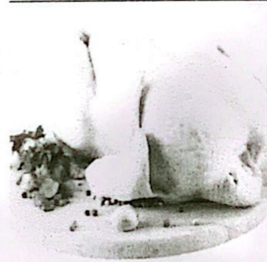
DAGING AYAH KETERSEDIAAN: 135,02 TON KEBUTUHAN: 89,85 TON