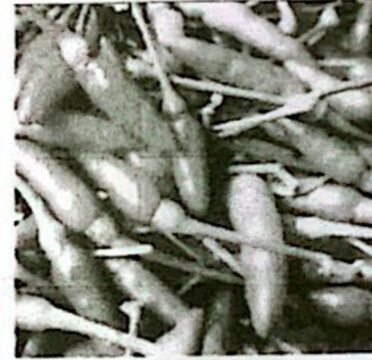
CABE RAWIT KETERSEDIAAN: 16,73 TON KEBUTUHAN: 10,42 TON