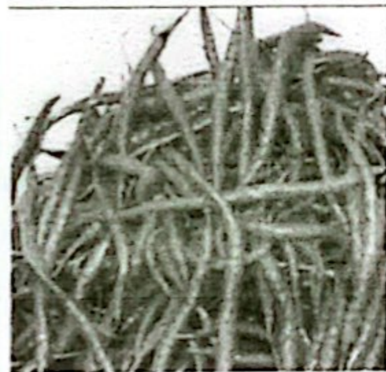
CABE MERAH KETERSEDIAAN: 73,42 TON KEBUTUHAN: 50,50 TON